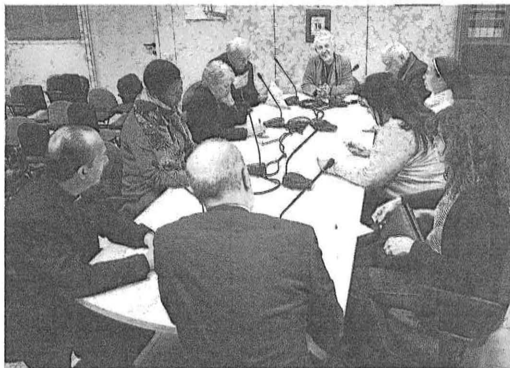
Riunione di redazione a "Donne, Chiesa, mondo".

L'iniziativa. Il segretario di Stato Parolin presenta il mensile curato da una redazione di sole studiose