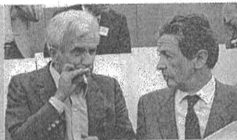
CON BERLINGUER Un'immagine di Magri con Enrico Berlinguer